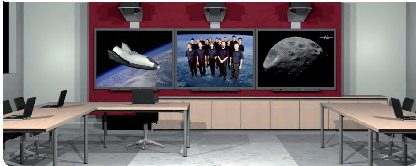
Am Sitz von Vanerum in Bochum nutzen 12 Mitarbeiter heute die Vorteile des Dokumenten-Management-Systems von Canon.